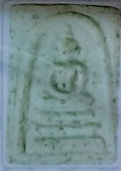
พิมพ์เกษบัวตูม