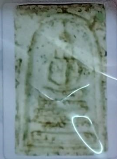
พิมพ์ฐานแบบ